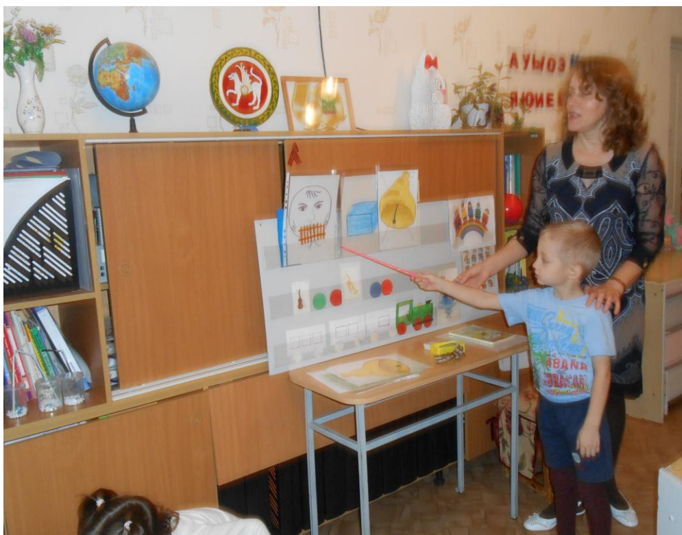
Дидактическое пособие «Согласный звук»