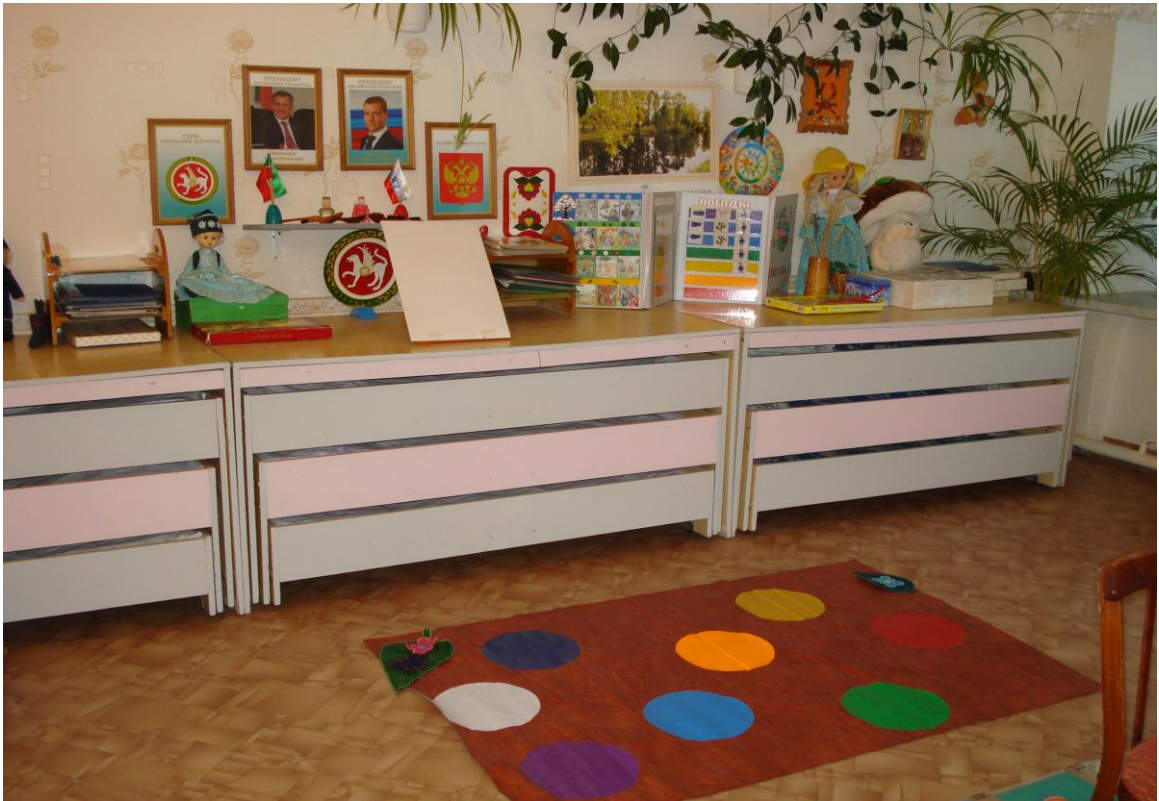
Цветная речевая дорожка