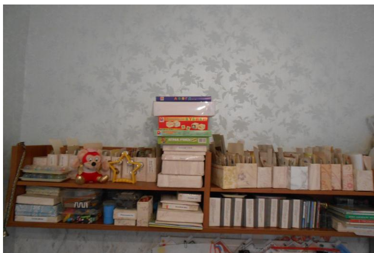
Дидактические игры для развития грамматического строя, связной речи.