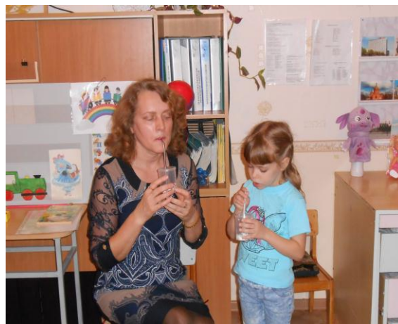
Пособия на выработку воздушной струи