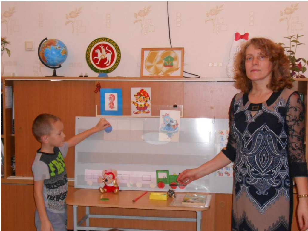
Дидактическое пособие «Домик», определение места звука в слове. Дидактическое пособие «Паровоз», деление слова на слоги.