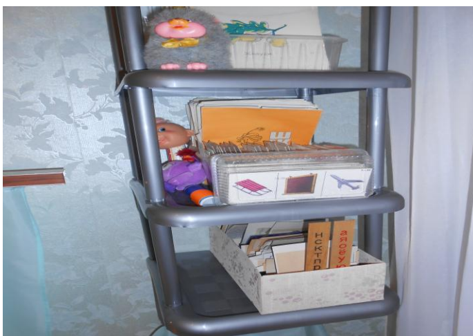
Дидактические игры для автоматизации и дифференциации звуков.