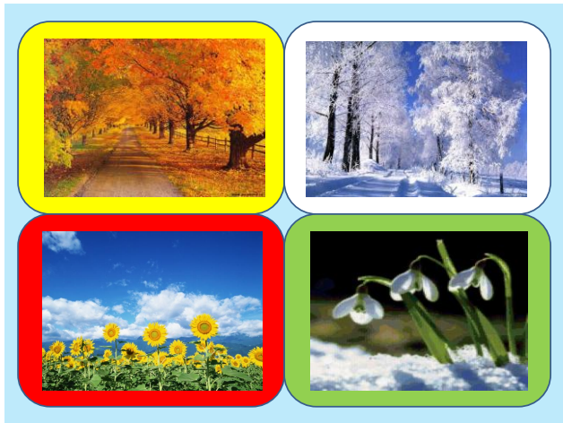
Иллюстративный материал по лексическим темам