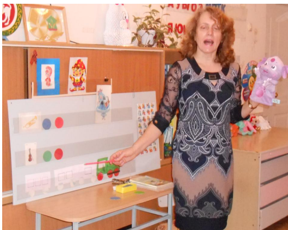
Играем на трубе твёрдо – па, на скрипке мягко – пя (графические схемы)