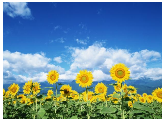
Картинный материал по развитию связной речи